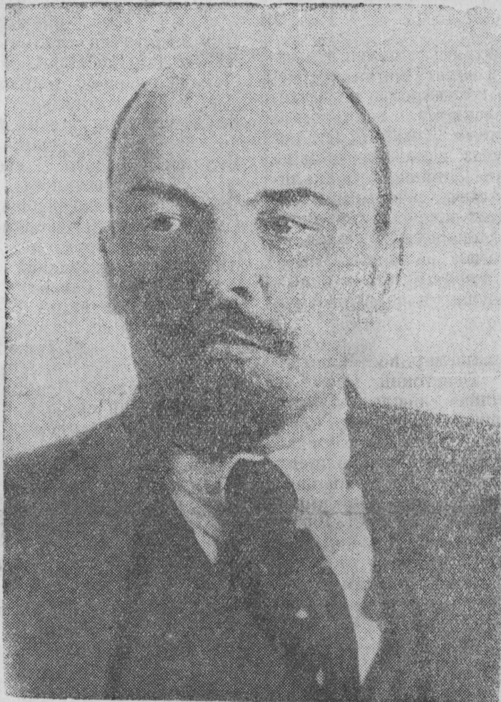
В. И. ЛЕНИН.

Совершенно другую картину мы имеем теперь. Промышленность СССР уже к концу 1937 года