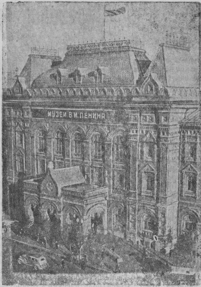
На снимке: Здание Центрального музея В. И. Ленина в Москве.