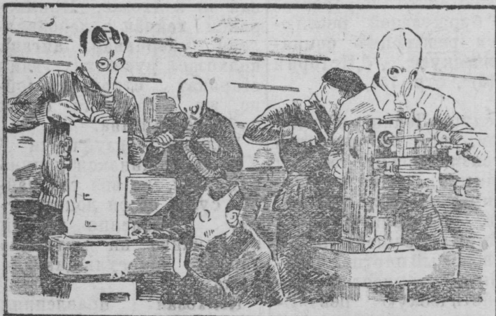
На рисунке: Бригада слесарей за работой в противогазах.

День обороны на заводе имени Масленникова (г. Куйбышев).