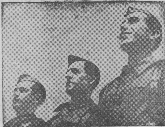
На снимке: Молодые летчики республиканского воздушного флота.