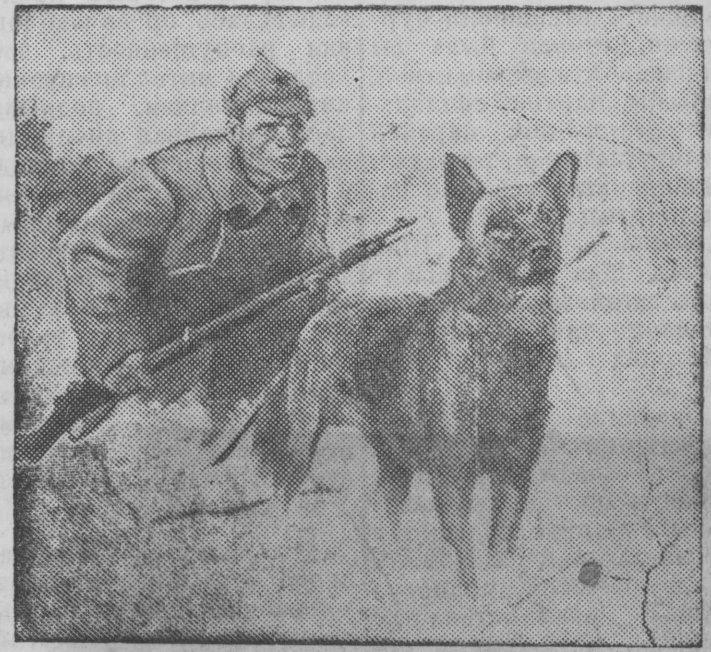
На снимке: „В секрете“ — картина художника А. К. Жаба.