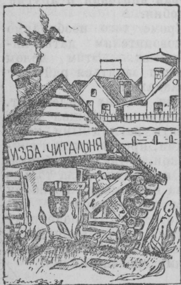
„ХАТА С КРАЮ“.