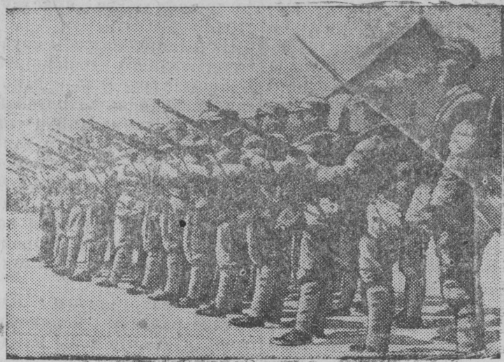
На снимке: Бойцы китайской армии на строевых занятиях.