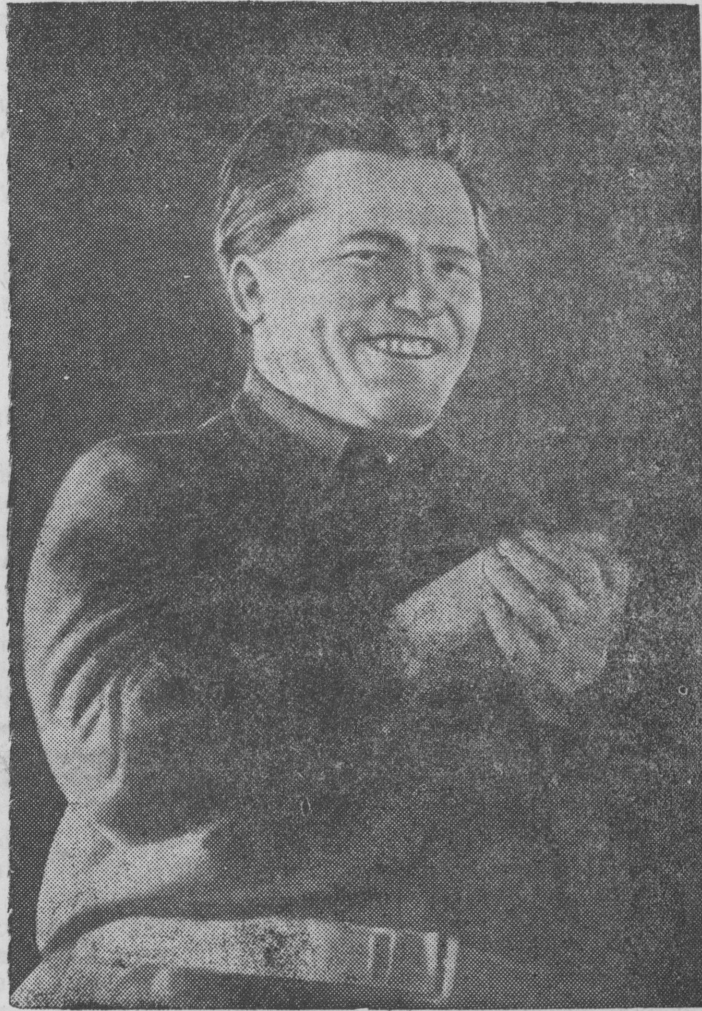
На снимке: С. М. Киров на V-й Ленинградской областной и II-й городской партконференции. (Январь 1934 г.).

Подлые враги народа боялись разящего кировского слова, враги народа ненавидели Кирова, и они убили его злодейским выстрелом из-за угла.