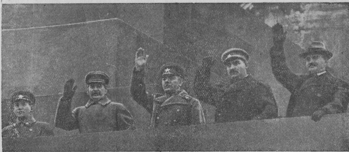
На снимке: Руководители партии и правительства (справа налево) В. М. Молотов, Л. М. Каганович, К. Е. Ворошилов, И. В. Сталин и Н. И. Ежов приветствуют демонстрантов.

Празднование XXI-й годовщины Великой Октябрьской Социалистической Революции в Москве 7-го ноября 1938 г.