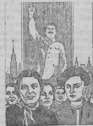
Планет Изюга работа художников М. Волковой и Н. Пинус.