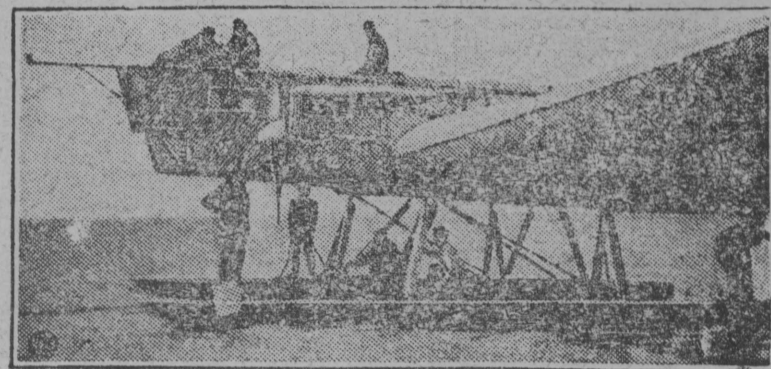
Самолет „Страна Советов“, на котором совершается перелет Москва-Нью-Йорк, был установлен в Хабаровске на поплавок и начал второй этап перелета до Сан-Франциско, где он снова будет поставлен на колеса. НА СНИМКЕ: „Страна Советов“ на поплавках.