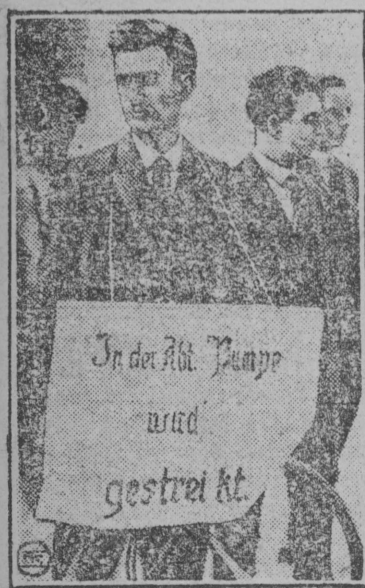
На радиозаводе Лёве в Берлине рабочие объявили забастовку.

НА СНИМКЕ: Пикетчик с плакатом на груди у фабричных ворот.