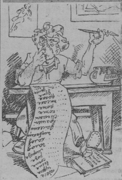
„Не мешайте планировать!“.