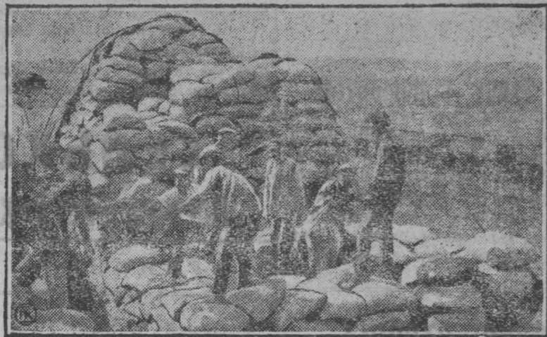
НА СНИМКЕ: Штабеля мешков с зерном нового урожая в Андреевском совхозе Ср. Волжской области грузят на тракторные прицепы, для отправки на элеватор.