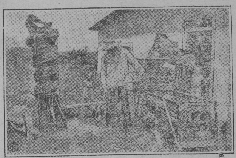
НА СНИМКЕ: Члены колхоза крестьяне с. Белики, Полтавского округа за очисткой посевного зерна.