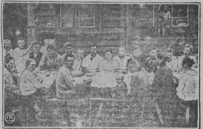
коммунары за обедом