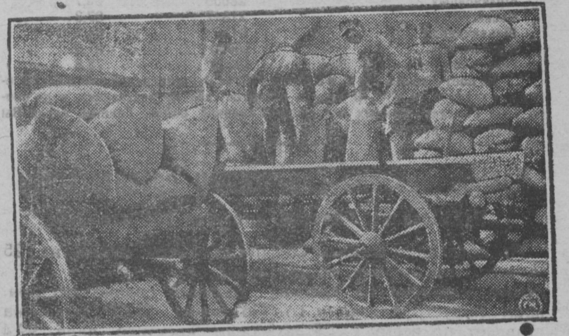
Выгружают привезенный хлеб