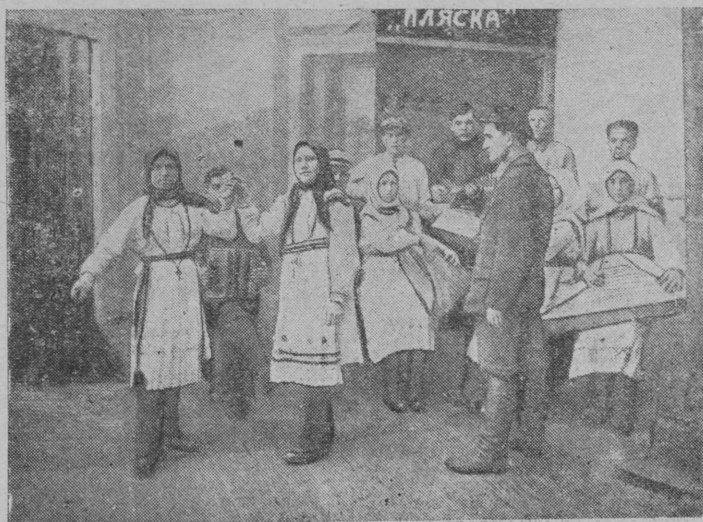
Кӕнӕм вӕрӕмӕм колхозышты культурны ӕртӕрӕт.