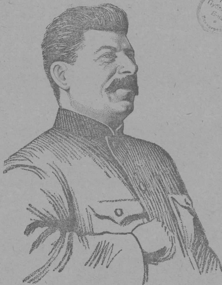
ВКП(б) Рүдö Комитет сәкретарь Иосиф Виссарионович СТАЛИН йолташ