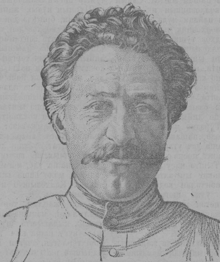
ССР Ушәм нэлэ Промышлэныс калык комисар ОРДЖОНИКИДЗЭ йолташ