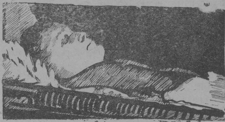
С. М. КИРОВ йолташ колоткаштэ

Револьуцион пашам Киров йолташ Томскэш тунгалын. Тушко тудо тэхнологический институтыш тунэмаш пураш шонэн мийэн улмаш. Тудо