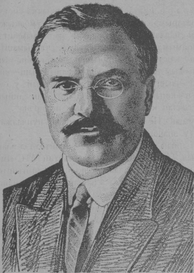
В. М. МОЛОТОВ йолташ