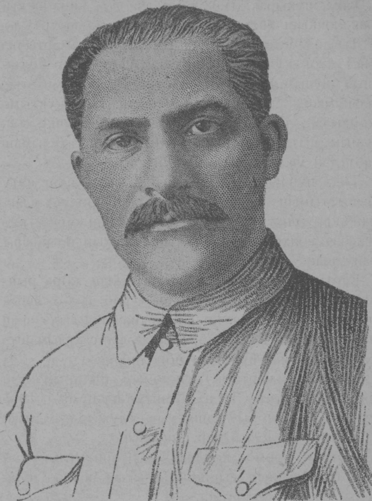
Л. М. КАГАНОВИЧ йолташ