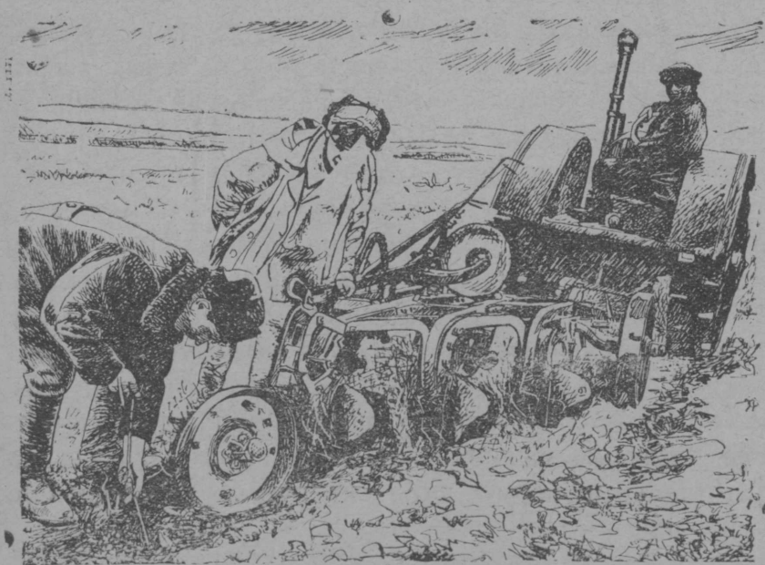
МТС политотдэл начальник колхоз пасушто куралмын кэлгытшым онча

Машина-влакым кучылт моштымаштэ да агротэхник йоным пуртымаштэ йатыр сэнгымаш-влак ышталтыныт. Совет Ушэмын йужо районлаштыжэ игэчэ томам ыльэ гынат тэний ұмасэ дэч шурным йатыррак налмэ. Киндэ