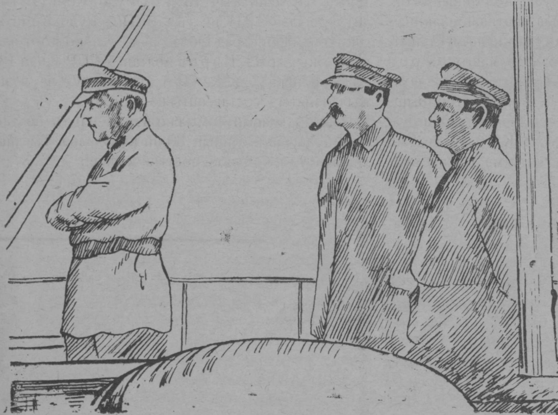
СТАЛИН, ВОРОШИЛОВ дэн КИРОВ йолташ-влак Бэлмор-Балтик каналыштэ.

1906 ий тунгалтышыштыжак партийнэ организацэ Киров йолташым Моско дэн Ленинградыш сай типографий машиным налаш колта, пашажым шуктэн ок кэрт: кайшаш кэчыштыжэ тудым