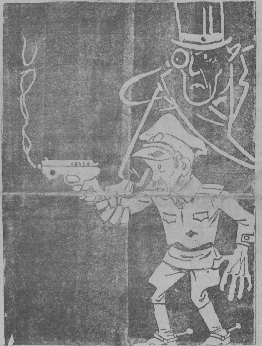
ЧЕМБЕРЛЕН: Вот так держи руку, по смелее будь.

Разговоры идут о разоружении, а на деле Англия способствует Чан-Кай-Ши—расстреливает рабочих и крестьян.