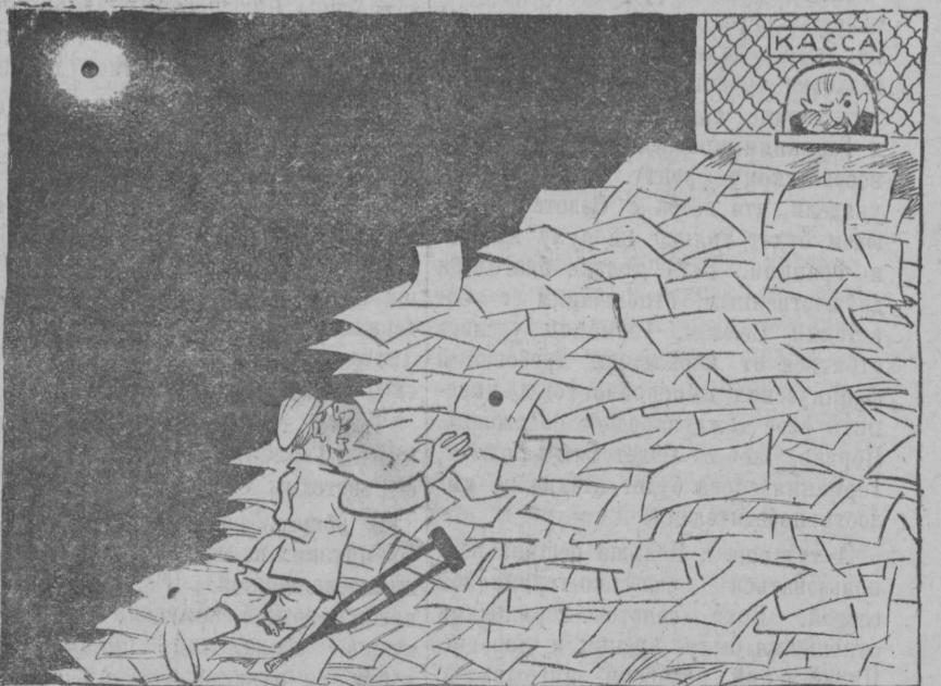
В такой кассе облигацию не за что не купиш.

2 апреля в Малой Азии в гор. Смирне произошло сильное землетрясение. Толчки продолжались до утра. Разрушено много домов. Убито 25 чел., ранено свыше 60 чел.