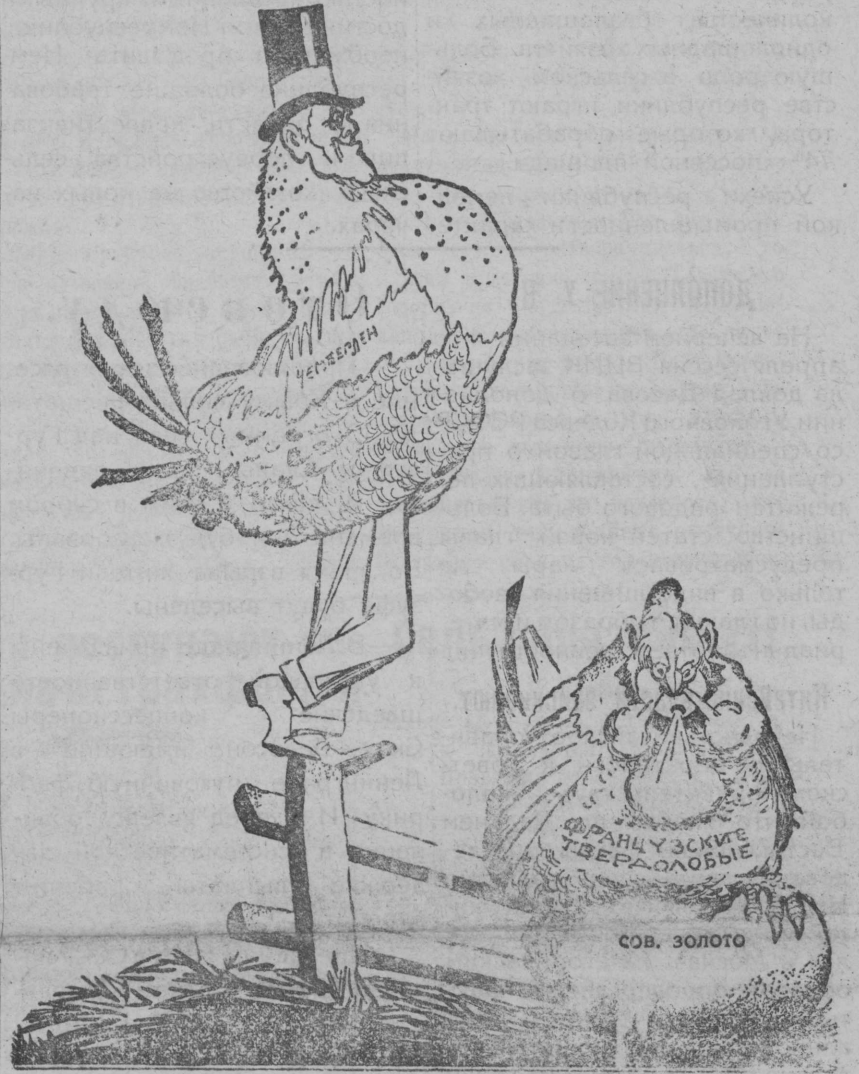
ЧЕМБЕРЛЕН: Довольно, ничего не выходит, слезайте.

Французские твердолобые пытались грабительским путем захватить советское золото отправленное в Америку. Золото было задержано. Сейчас ньюйоркские банки в иске французским твердолобым отказали. Золото направлено в Германию.