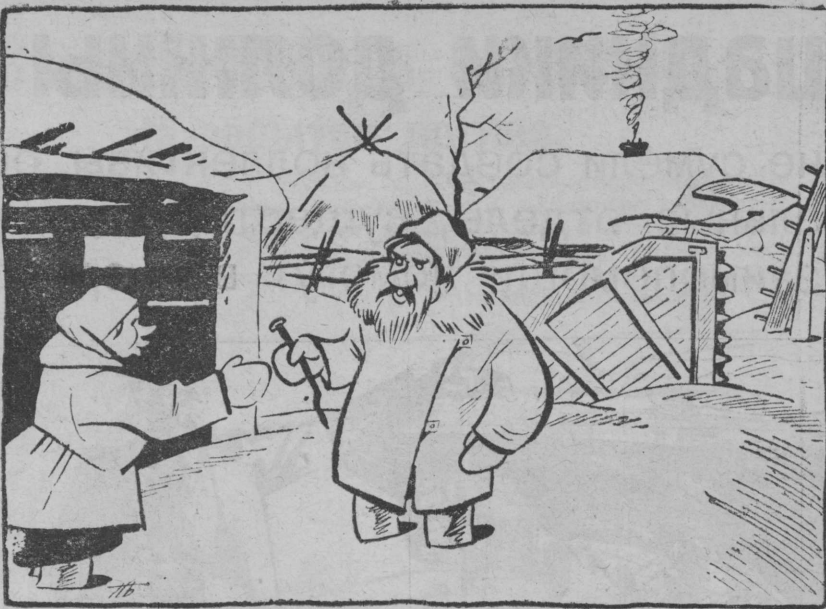
С-х машины из под снега еще не вытаяли хозяином их, к посеву еще не готовятся.