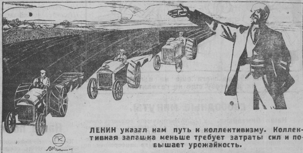
ЛЕНИН указал нам путь к коллективизму. Коллективная запашка меньше требует затраты сил и повышает урожайность.

Бедняки, если вы не сумели создать коллективы, объединяйтесь в супруги и посевные группы. Земельные отделы, существующие колхозы, агрономы, комитеты взаимопомощи помогут вам средствами и советами.