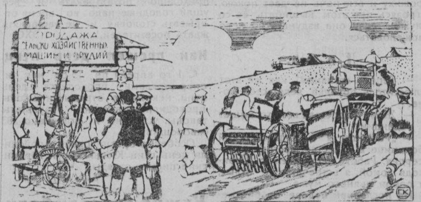
Бостoны машинаез. Лoбoтчoны кoзан кад-кежo.