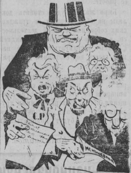
Гады строят свои гнусные планы — замышляют новые террористические акты.