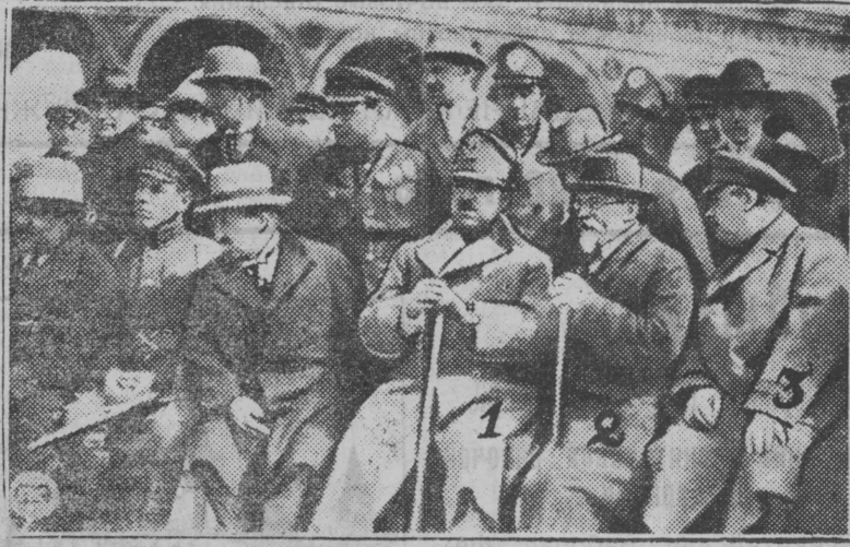
На снимке посещение падишахом Кремля. 1. Аманулла-хан 2. т. Калинин 3. т. Енукидзе.

В недрах Афганистана имеются большие запасы угля, серебряной