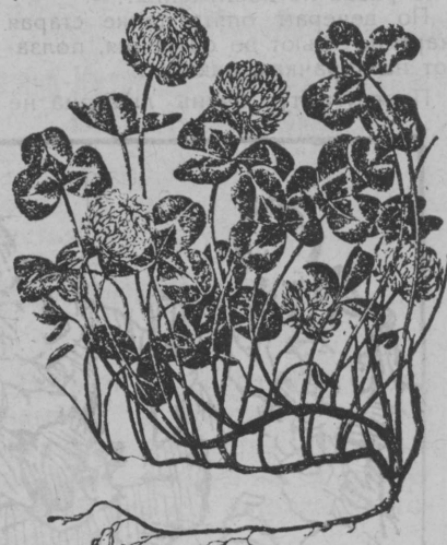
Клевер содтө мулө вын.

— „Обнажите свои головы“, я буду говорить вам о мучениках трех-