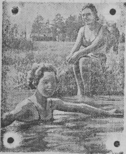
На снимке: ученицы 10 школы Окт. р-на (гор. Москвы) купаются в Тимирязевском пруду.