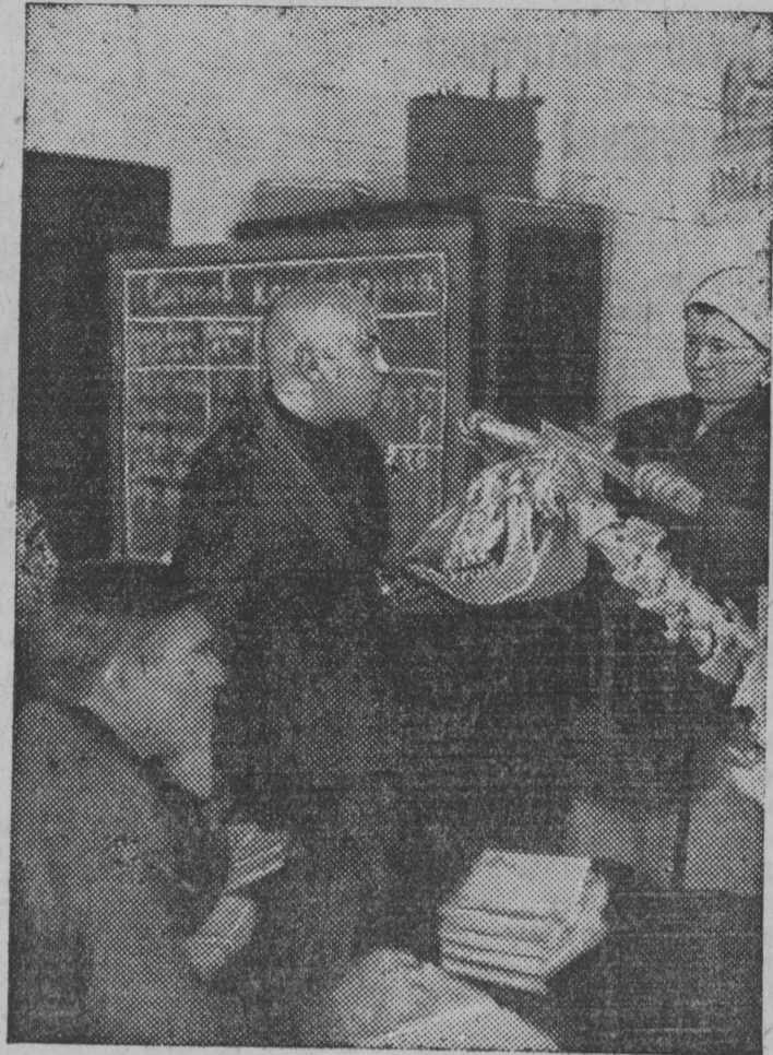
Колхозный актив за изучением скелета коровы.