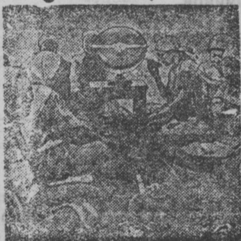
Колхозники слушают радио