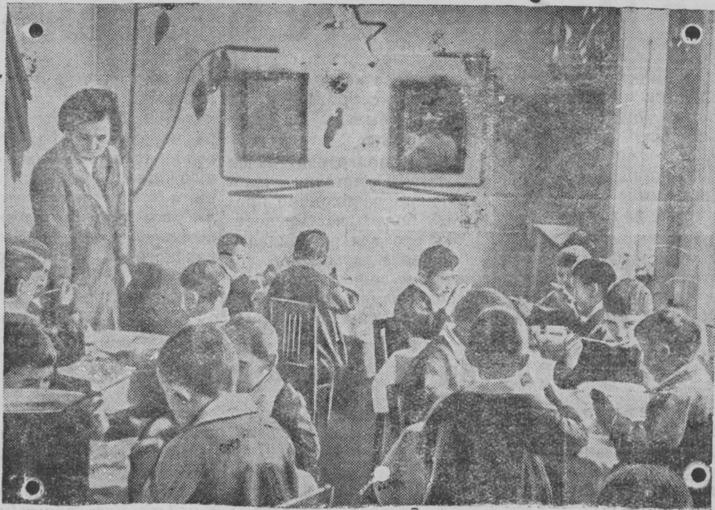
НА СНИМКЕ: Обед в столовой детплощадки фабрики имени Калинина в гор. Калининне.

За все время своего существования он дал 2.450 тыс. тонн нефти. За 4 мес. этого года добыто столько же нефти, сколько за весь 1933 год. Сейчас здесь интенсифицируется около 150 скважин, систематически бурятся не меньше 20 скважин. Вышки усеяли весь вулкан, забралась в самое жерло его. Всюду находят нефть.