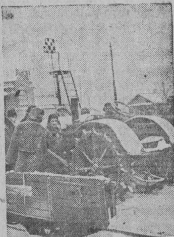
Прибыли новые тракторы