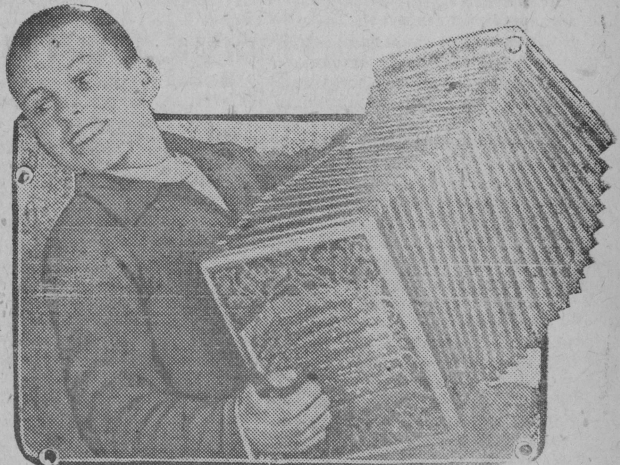
Opaštajalla 6' klassua Mišnevskoida školua, Novosokolniceskoida raionua Mišalla Dohtenkovalla tuatto oštö šoitun. Snimkalla: Miša uvvenke šoitunke.