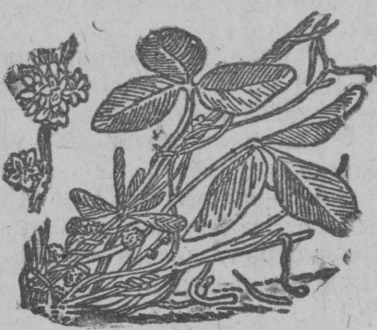
Клеверная повилка сорняк — паразитопутавший стебли клевера

Таким культиватором хорошо обрабатывать междурядья посевов кормовых корнеплодов, столовых корнеплодов, подсолнуха, который обычно сеется у нас на