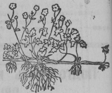
Люттик ползучий, — размножается укореняющимися плетями.

или ячмень, то и эти посевы обязательно нужно выпалывать. Как только всходы окрепнут и подымутся примерно на 10—