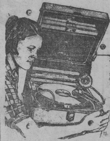
Проверка патефона перед отправкой в сельпо

Однажды был такой случай. Когда в Лихославль прилетел агитсамолет эс-