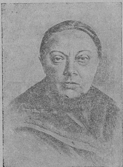
Н. К. КРУПСКАЯ.