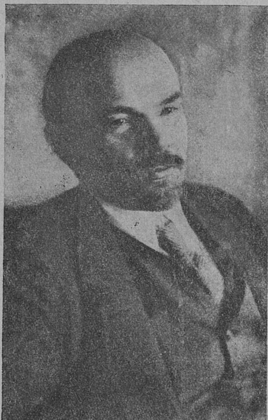
ВЛ. ИЛ. ЛЕЊИН.