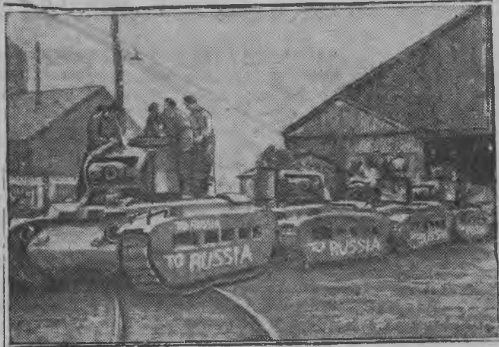
—Англин „СССРлы танк'ёс“ лэсьтон арня. Одйг английской заводын лэзем танк'ёс. Заводын ужасьёс к важной танк вылэ гож'яллям: „В Россию“.