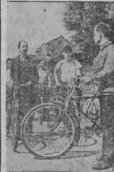
Москваысь народной ополченлэн подразделениез боевой дышетскон бордын. Связист'ёслэн подразделениезы