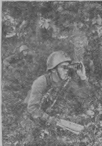
Н-ской полклэн разведчик'ёсыз М. В. Сингаевской младшой лейтенант (азьпалаз) кивалтэм улсын противниклэн позицияз пробираться карыськы.