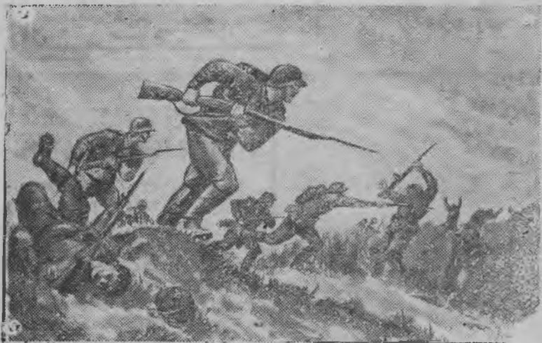
Кышкыт штыковой атакат! Пег'э фашистской войскас: Тушмонлэн вековой привычкаез— зуч штыккель пег'эзон.