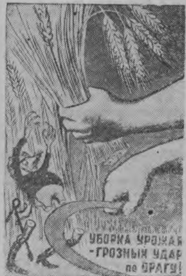
УБОРКА УРОЖАЯ — ГРОЗНЫЙ УДАР на ВРАГА!