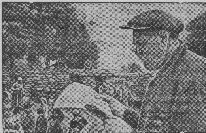
ОДЕССА ГЕРОИЧЕСКИ ОБОРОНЯТЬСЯ КАРЕ. Одессаысь трудящийёс дасесь палгытыны тушмонлэсь котькычэ шукнетсэ.

ны. Озы ик пöянзы немецкой захватчик'ёс Советской Союз выле уськытскемзы бере но. Соос ялызы соку „Сталинлэсь линизэ“ чигтыса пыр потымы шуыса. Советской Информбюро валэкт'из, что но кычэ юнматэм „Сталинлэн линизэ“ ой вал, огшеры полевой укреплениос сяна. „Ста-