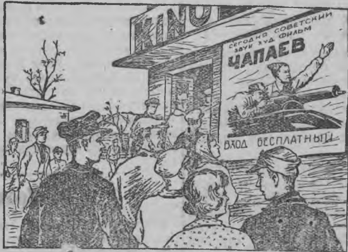
Чапаев выльсь массаез нюр'ясыкыны жутэ.

Западной Украины но Западной Белоруссии советской кинофильм'ёс бадзым успех'ёсын пользоваться карисько.