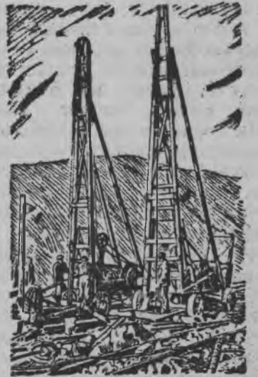
Суред вылын: Бурильной станок'эс рудаез аммоналэн взорвать карыны скважина-осты дасявны.

Ленинградской областысь Кировск городлэн районэз миллиардлэсь но трос апатитовой руда вань. Кировской апатитовой рудник'эс, куд'эсыз быдэс мирьсы крупнейшоен лыд'ясько ужаны лэзем дырысен 8,5 миллион тонна руда сётызы няи. Кировск городысь обогатительной фабрика апатитовой рудаез прерватить „камень плодородилы“ каре, векчи порошоке—apatитовой концентратэ, кудыз ценнейшой удобрениен лыд'яськыса аслам родинауьс колхозной но совхозной муз'ем вылэ раз-воньсы карыське.