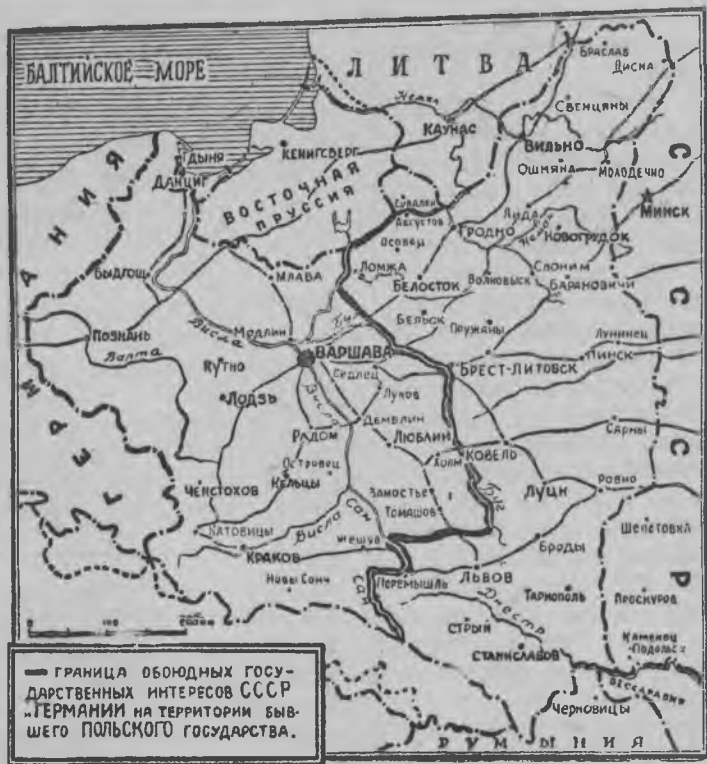
Бывшй Польской государстволэн территория вылаз СССР-лэн но Гермавилэн Обоудной государственной интерес'ёсылэн границазы.

ни. Соин вискарытэк валэктон уж нульськыл'ыз.