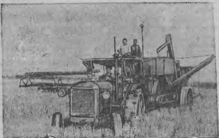
СУРЕД ВЫЛЫН: Грузинской ССР-ысь Синахской районьсь „Динамхрис“ колхоз йды октон-калтон бордын.

ОАХ-лэн райсоветэз ПОЗДЕЕВ РайСФК ВЕРЕТЕННИКОВ