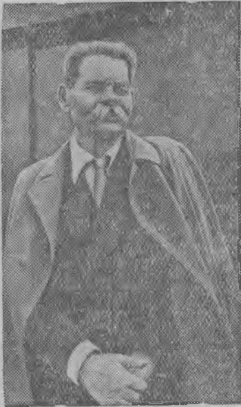
А. М. ГОРЬКИЙ.

Октябрьской революция ортчем бере, Горький вань кужымзэ сётйса культурной