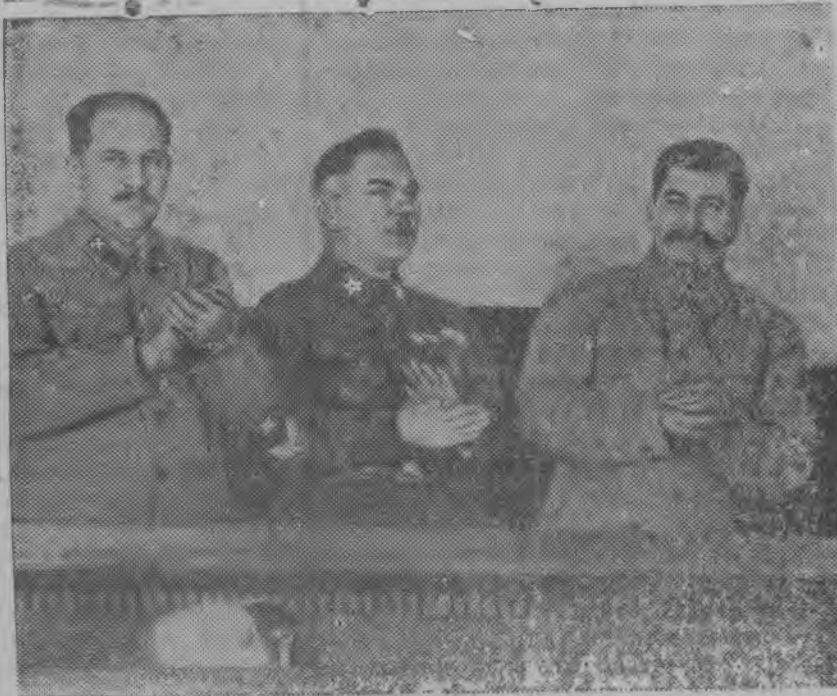
ВКП(б)-лэн XVIII с'ездэзлэн президиумаз (бурьсен палляне): Сталин, Ворошилов, Л. М. Каганович, Микоян, Молотов, Берия но Жданов эш'ёс.