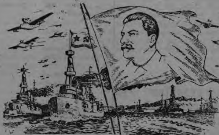
Дано мед луоз Советской Союзлэн Военно-Морской Флотэз—Советской морской границаослэн надежной охраназ!

1932 аре Сталин эшлэн инициативаз'я кылдытэмын Тихоокеанской флот. Грозной стражен сылэ Тихоокеанской флот роина-