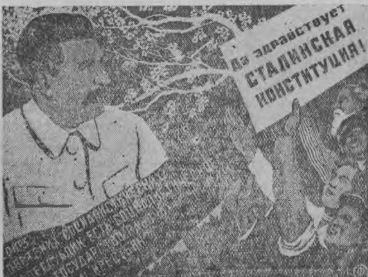
Дано мед луоз Сталинской Конституция!

Асьме Советской странаын гинэ котыкыныллы доступно наградаосыз бастыны.