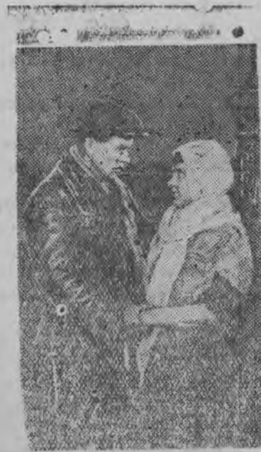
СУРЕД ВЫЛЫН: Фильм-лэн хорез Чибисов Катяен прощаться карыське: Чибисовлэн роляз—артист В. Лукин, Катялэн роляз—артистка З. Федорова.

„Ленфильм“ Ленинградской киностудии „Человек с ружьем“ кинокартиналы с'емка мынэ