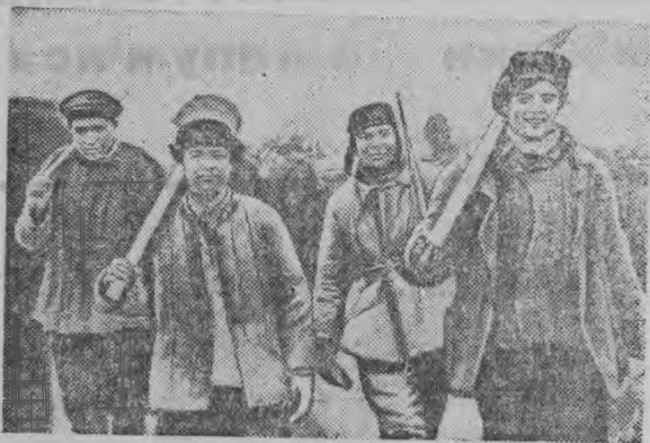
Днепростройысь бетонщик'эслэн комсомольской бригады.