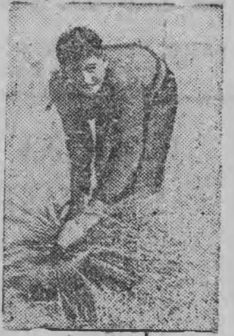
Суред вылын: Республиканской армиялэн боецез крестьян'ёслы уборка ужын юрттэ.