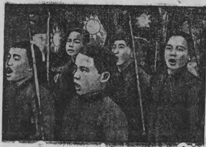
СУРЕД ВЫЛЫН: Китайысь егит'ёс антияпонской демонстрациын.