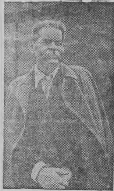
А. М. Горький.

Озы ик колхоз остальной- зэ етинэз но зерновой куль- тураосты урон организовать кариз. Урыськон ужын ды- шетскысь пинал'ёс но ужало. АЛЕКСАНДР В.