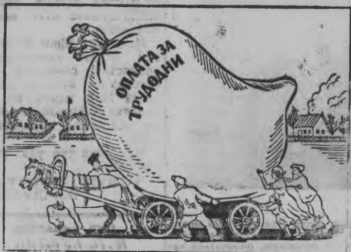
Колхозник'ёс, кудыз трос трудодень заработать каро но мырдэм нуо.