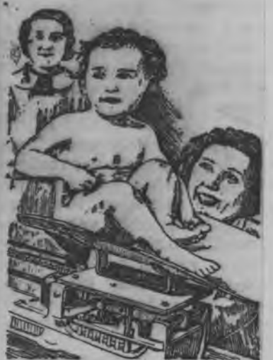
Испаниись республиканской правительство нылпиос понна зол сюлмаське, Суред вылын Мадридын нылпиослэн консультацизы.

бадзым мылкыдын базар пала учкыло, ужаны мылкыд одйгеzlэн но өвёл.