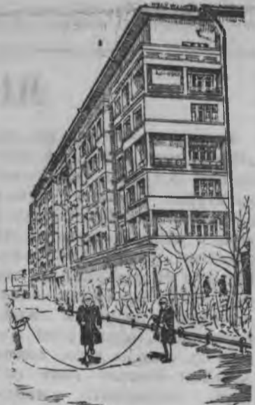
Москваысь Сталинлэн нимыныз нимам автозаводлэн выль жилой домез.