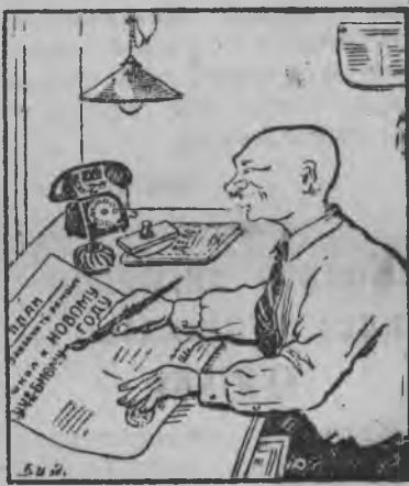
ОЧКОВТИРАТЕЛЬ: — Та бере мед кинке виновен лэд’ялоз на планэз срывать карем понна.

Тужгес ик РОНО-лы малпаськоно вал, дышетсконо луиз но соку школаез ремонтировать кароно шуса веразы. УЧЕНИК’ЭС. А.