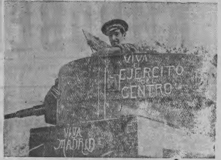
СН: Республиканской армиись танкист. Танк вылаз гожтэмын: „Дано мед луоз Центральной фронтлэн Армиез“. Дано мед луоз Мадрид“.