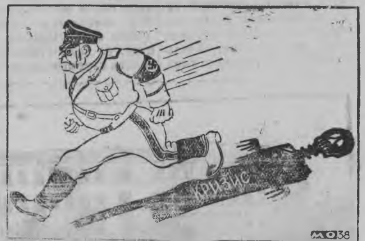
—Кызы ке но ас вужерелэсь избавиться карыськоно вал...

Толон данак интыосын митинг'эс ортчизы. Соос лейбористской партиен организовать каремын вал. Митинг'эсын вераськисьёс Англилэсь, Францилэсь, СССР-лэсь но Чехословакилэсь единой фронтсэс кылдытыны кулэ луон сярэсь пусыйлызы. Куд-огез вераськисьёс страналэсь вань прогрессивной кужым'эссэ огазеян сярэсь предложение сётылызы.