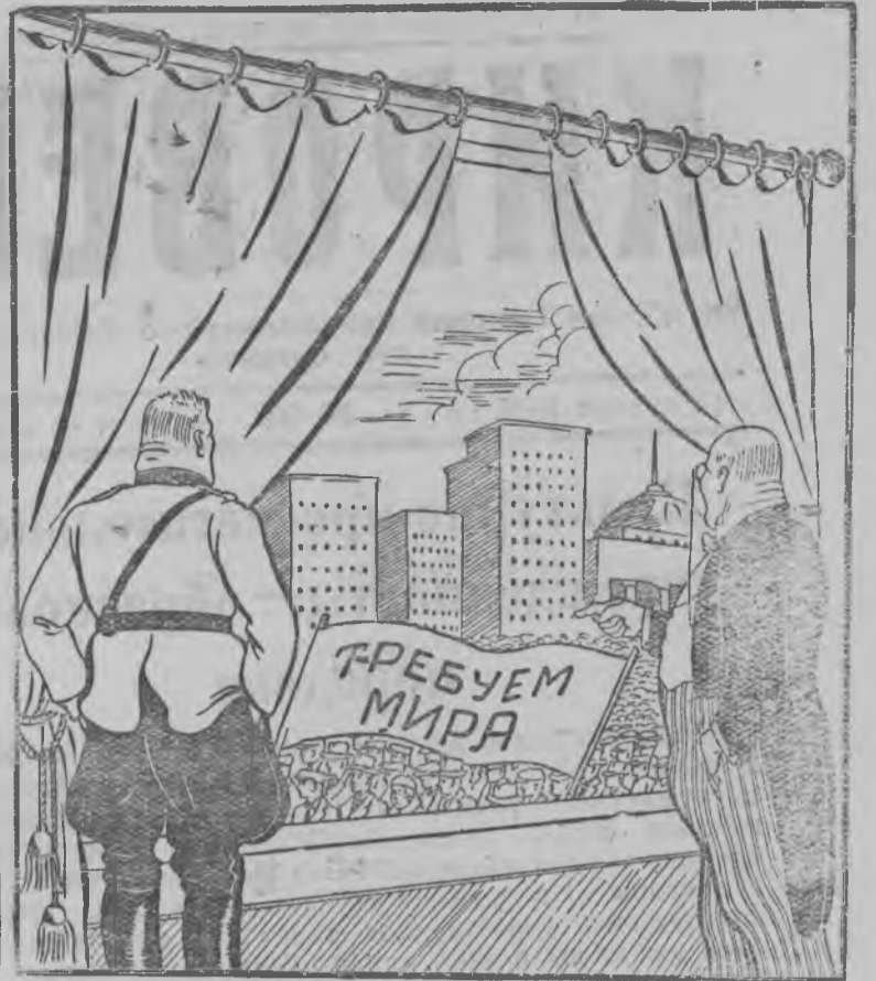
—Кызы та асьмелэн полициямы коммунистической пропагандаез допускать каре!

„Петр Великий“ судноез жутынын егит'эс ужазы, ваньзы сямэн ик соос комсомолец'эс. Заданиоссэ соос 200—300 процентлы быдэс'яллызы.