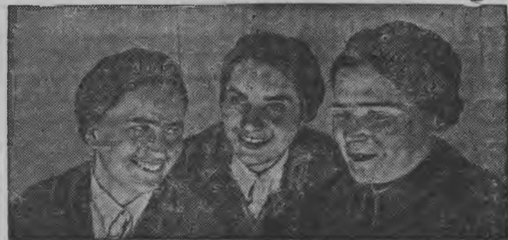
СНИМОКЫН: „Родина“ самолетлэн героической экипажэз (паллян палысен бурпала) М. М. Раскова, В. С. Гризодубов, П. Д. Осипенко.