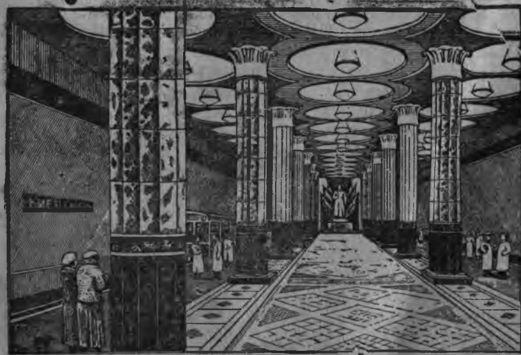
„Киевская“ метрөлэн станциезлэн пушкыз,