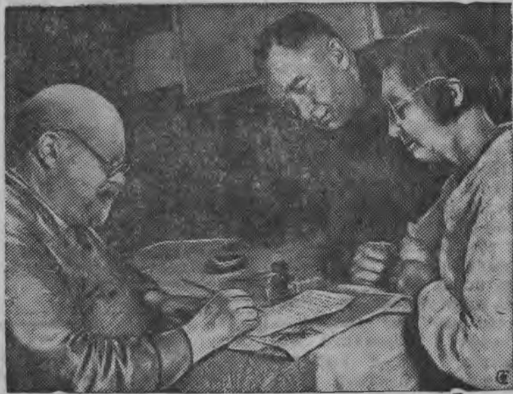
(Паллянысен бур пала, М. М. Громовлэн Атаез—М. К. Громов „русской авиацилэн дедушкаез“ Б. И. Россинский, М. М. Громовлэн анаез—Громова Л. Н. Сталин эшлы гожтэт гожто.