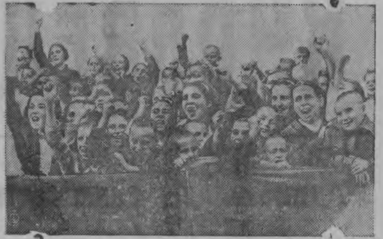
Испаниысь пинал'ёс Ленинградской портын „Феликс Держинской“ теплоходлэн бортаз