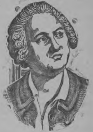
М. В. ЛОМОНОСОВ

Великой русской ученойлэн но писательлэн М. В. Ломоносовлэр кудлэмеэ дырысен 15 апреле 175 ар тырмиз.